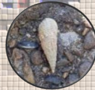
ウェルカムリストCランク ホソウミニナ