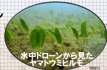
水中ドローンから見た ヤマトウミヒルギ

※参加費無料 (ただし、会場参加については博物館の入館料が必要) ※事前申し込み制。