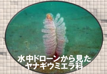
水中ドローンから見た ヤナギウミエラ科